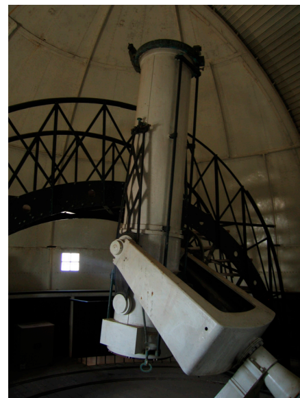
Le télescope de Foucault est équipé d'un des premiers miroirs de 60 cm, en verre aluminé.

L'observatoire d'Alger participe alors au grand projet international de la Réalisation de la Carte du Ciel.