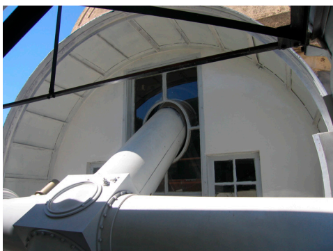
La lunette coudée (Objectif de 32 cm de diamètre et 6,4 m de distance focale).

Dirigé par Monsieur Yellès , sismologue, il a pour activité principale la surveillance sismique grâce à un réseau national et international. Ces études permettent de localiser les séismes, d'analyser le suivi des crises, de comprendre le mécanisme au foyer et d'interpréter la déformation due aux séismes.