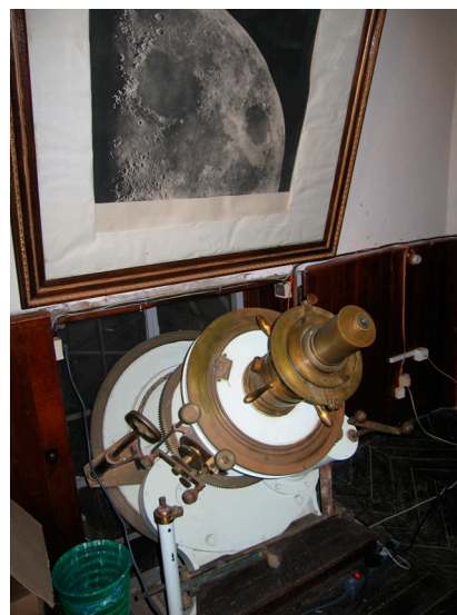
La salle d'observation de la lunette coudée... [on se croirait à Saint-Genis Laval].