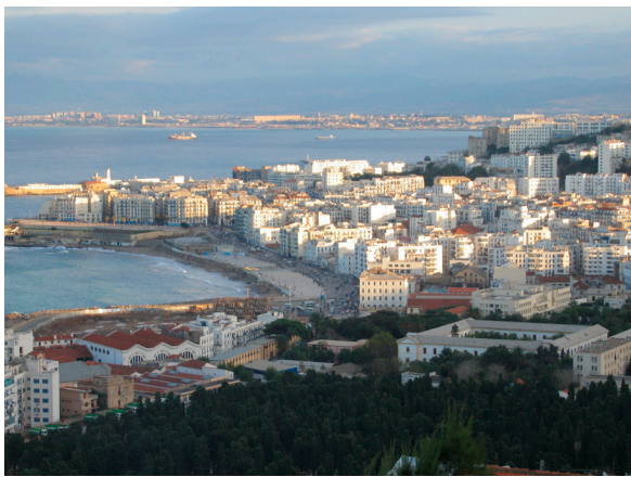
La magnifique baie d'Alger

Résumé : En Algérie, le Centre de Recherche en Astronomie, Astrophysique et Géophysique (CRAAG) abrite un observatoire d'astronomie connu autrefois comme l'Observatoire d'Alger. Du haut de son rocher à 340 m, le Centre surplombe la mer. Il regarde l'horizon bleu mais surtout il écoute la Terre et regarde le Ciel.