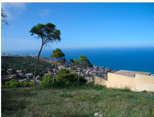
L'observatoire d'Alger... un paysage extraordinaire.

L'observatoire d'Alger fut créé en 1856 et rapidement installé sur les hauteurs de la ville à Bouzaréah.