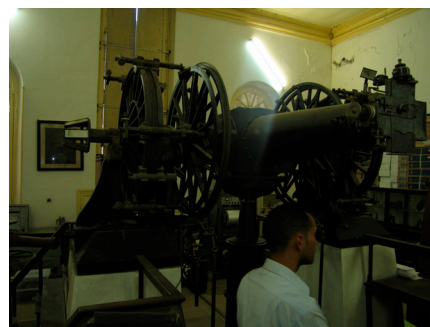
La lunette méridienne pour le service de l'heure, [elle aussi similaire à celle de l'observatoire de Lyon].

En Septembre 2007, a été ouverte à Constantine, une École Doctorale d'Astrophysique, la première au niveau de l'Algérie et du Maghreb, qui permettra de poser les fondements de l'astronomie universitaire en Algérie.