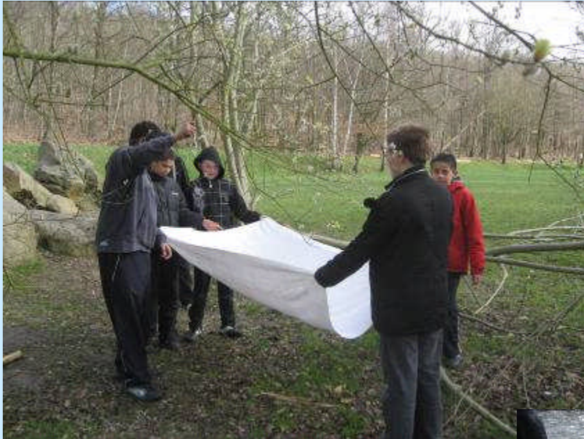
Le parapluie japonais

Découverte de la faune grâce à différentes techniques de capture