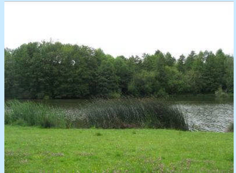
Le bois de la crâne en mai