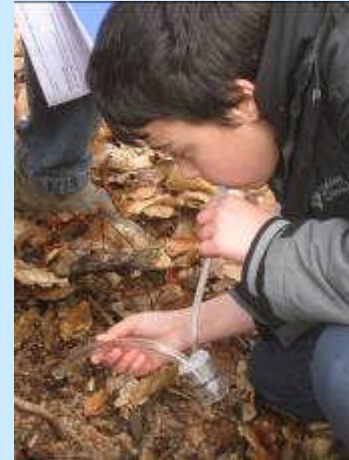
L'aspirateur à insectes