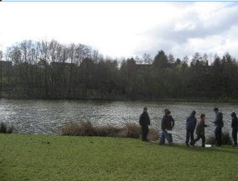
Le bois de la crâne en mars

Lecture d'un paysage, Pêche de la faune aquatique, Fouille de la litière, Identification des essences.