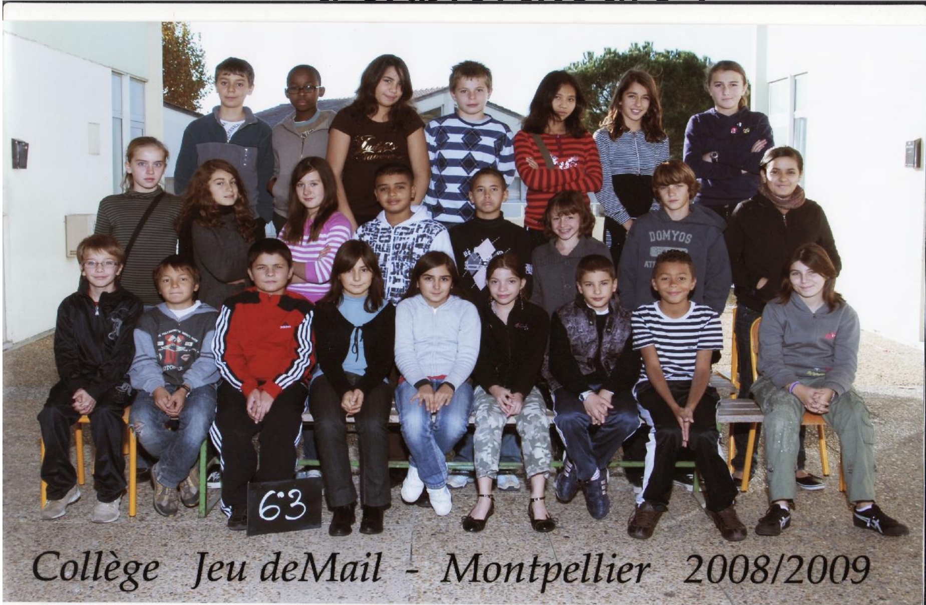
Collège Jeu deMail - Montpellier 2008/2009