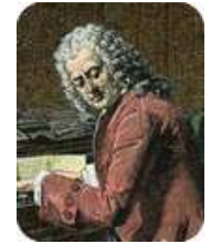
Fig.1 Jean Sébastien Bach, l'un des promoteurs de la gamme tempérée

En musique, la gamme tempérée ou gamme au tempérament égal , aussi appelée tempérament égal , est un système d'accord qui divise l'octave (rapport 2 en douze intervalles chromatiques égaux). Il existe plusieurs manières de définir les fréquences des notes d'une gamme. Dans la gamme tempérée , le rapport entre une note et la note suivante (appelé demi-ton) a une valeur constante valant 2^{1/12} . Ainsi la gamme tempérée est une suite géométrique de raison a = 2^{1/12} . On se propose de vérifier cette affirmation.