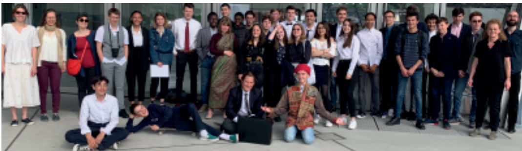
Classe de 2 o

En conclusion, cette journée d'échanges et de négociations a porté ses fruits, globalement les promesses faites amèneraient à une réduction totale de 26 Gt de CO 2 pour 2100, ce chiffre correspondrait à retirer les émissions de CO 2 de la Chine ! Tous ces efforts, s'ils sont fournis, amèneraient la planète à se réchauffer de 2,8 degrés d'ici 2100 soit 0,5 degré de moins que ce qui était prévu par rapport aux promesses de la COP21. Espérons que ces promesses seront tenues, et il n'est pas trop tard pour sauver la planète !