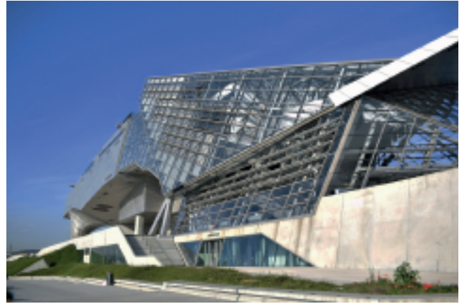
Musée des confluences, @ninocavallo

Ce vendredi 24 mai 2019 s'est déroulée la COP 24 au musée des Confluences regroupant les délégations : États-Unis, les îles Fidji, le Canada, l'Inde, le Brésil, l'union européenne ainsi que notre délégation le Maroc. Comment ces délégations vont-elles se mettre d'accord face au dérèglement climatique ?