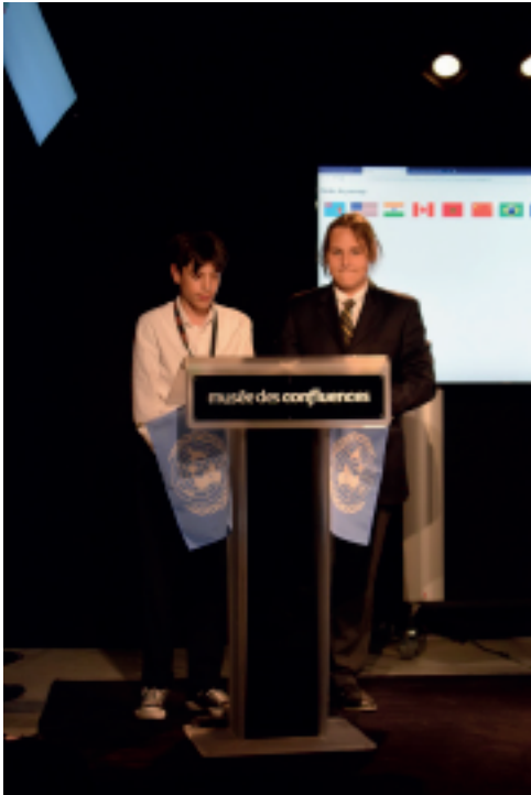
Discours du Maroc, Jules et Basile, @ninocavallo

Notre pays est très engagé face au dérèglement climatique malgré un faible développement et des moyens financiers réduits. En effet, le roi du Maroc Mohamed VI est surnommé le « roi vert » grâce à sa politique écologique. Tous ces efforts sont dus à l'avancée très rapide du Sahara qui menace les terres marocaines. Le Maroc est d'autant plus impliqué dans la lutte contre le dérèglement climatique car 90 % de son mix énergétique est issu des énergies renouvelables. Le but de cette conférence était d'établir des accords climatiques entre les 7 délégations. Le Maroc a pu négocier pendant 1 heure avec les autres délégations. Après ces dures négociations, le Maroc a tenu un discours de clôture où il évoque ses promesses en fonction des accords pris. Le Maroc promet une réduction de CO 2 de moins 0,33 Gt par an d'ici 2100 ainsi qu'une baisse de 4,5 % de la production de gaz à effet de serre. Le Maroc est un exemple à suivre !