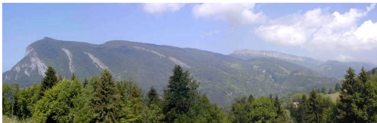
fig 1 : Panorama en direction du Nord, de Roche Veyrand (à gauche) au col du Mollard (au second plan à droite)

Après s'être repéré et avoir identifié les principaux sommets (cf figure 1), la première étape de l'interprétation d'un panorama consiste à dessiner l'allure générale du paysage et ses principaux éléments. On repère ensuite à l'aide de la carte géologique les formations plus ou moins visibles à l'oeil pour ensuite déterminer les contacts anormaux. Tout ceci est représenté sur le croquis ainsi que les pendages (cf figure 2).