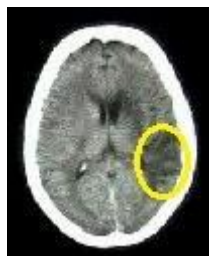
Figure 2 – IRM de la patiente (coupe axiale)

Une IRM a été faite, elle a permis de localiser une lésion cérébrale consécutive à l'accident vasculaire : chez cette patiente, la zone pariétale droite du cortex a été lésée.